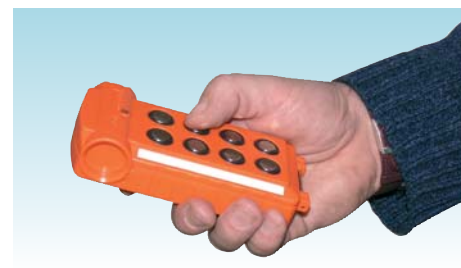
Пульт дистанционного радиоуправления