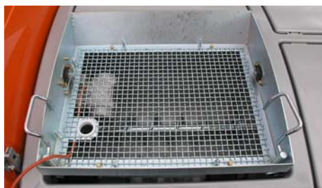
Защитная решетка приёмного бункера