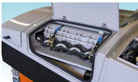
Секция для запасного шнека