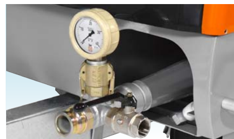
Подающий патрубок с манометром