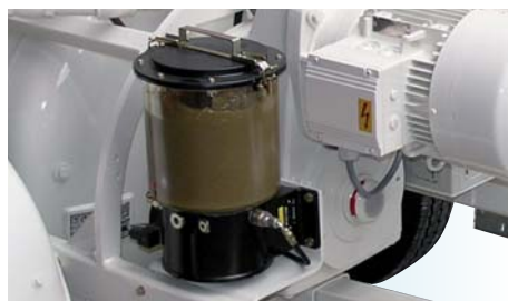
Центральная система смазки