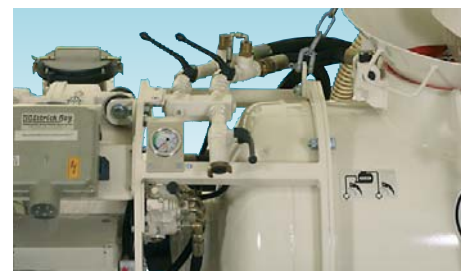
Элементы управления и подключение компрессора