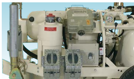
Подкладки под колёса, бак гидравлического масла