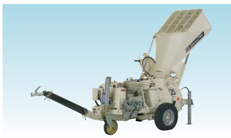
Estrich Boy 20 EB