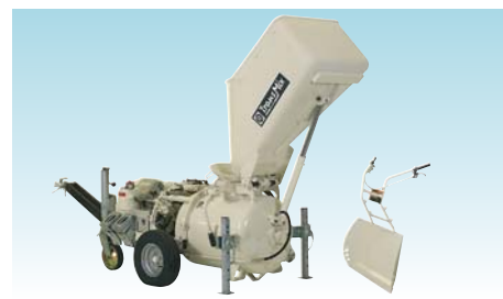
Estrich Boy 20 EBS