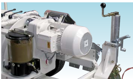
Электромотор 20 E