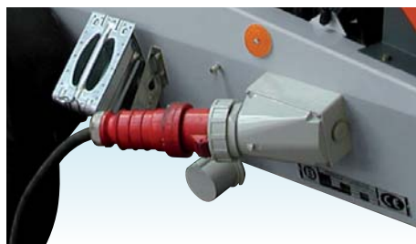
Подключение электрического тока