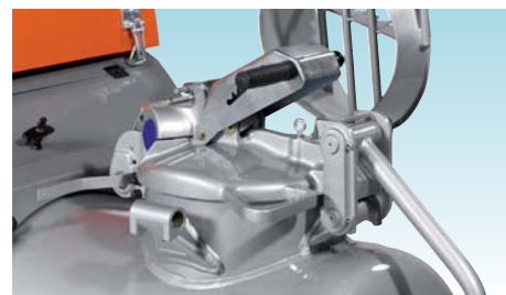
Крышка с автоматическим выпуском воздуха