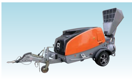
Estrich Boy 450 EB