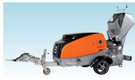
Estrich Boy 450 EBS